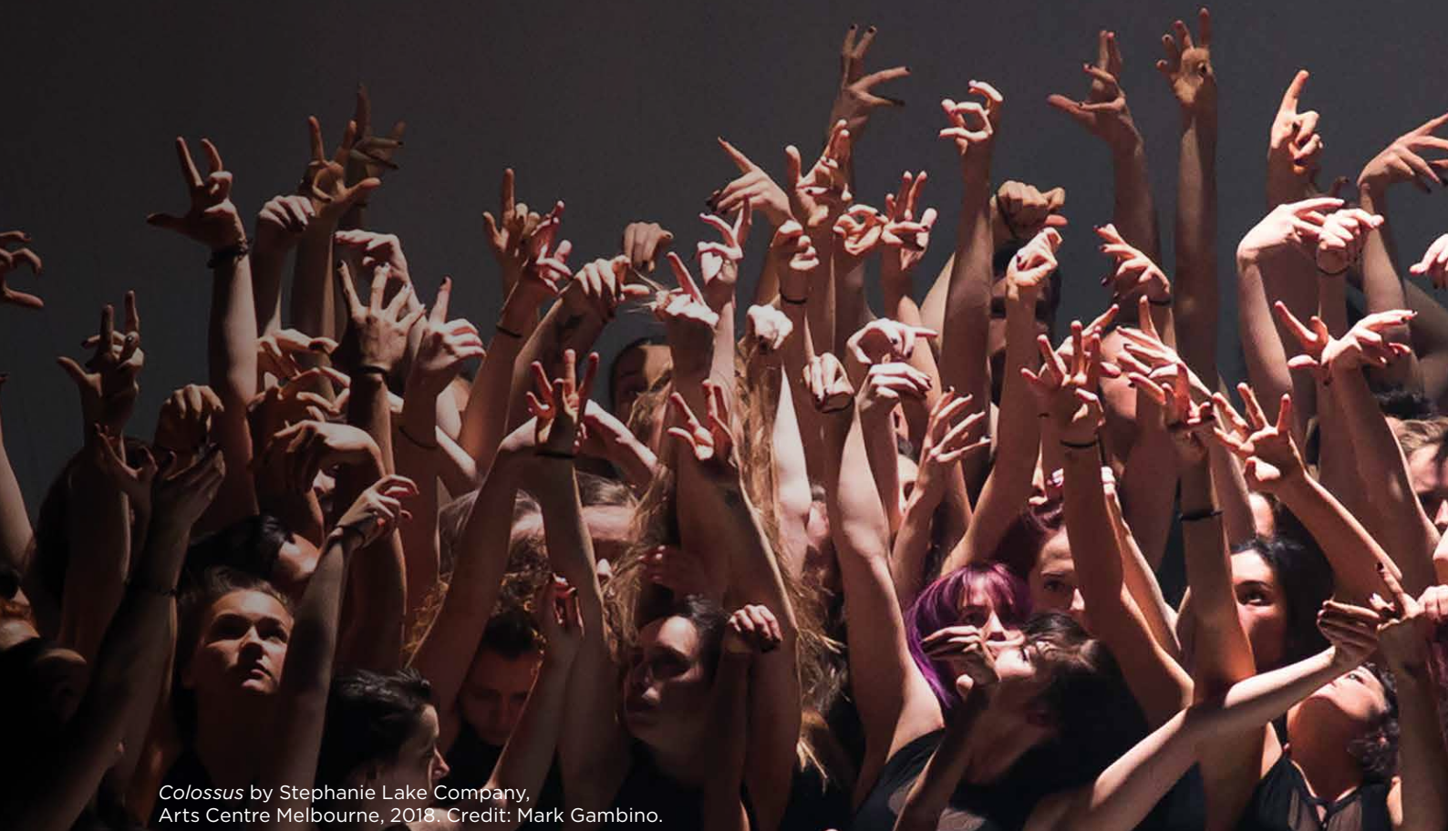
Colossus by Stephanie Lake Company, Arts Centre Melbourne, 2018.