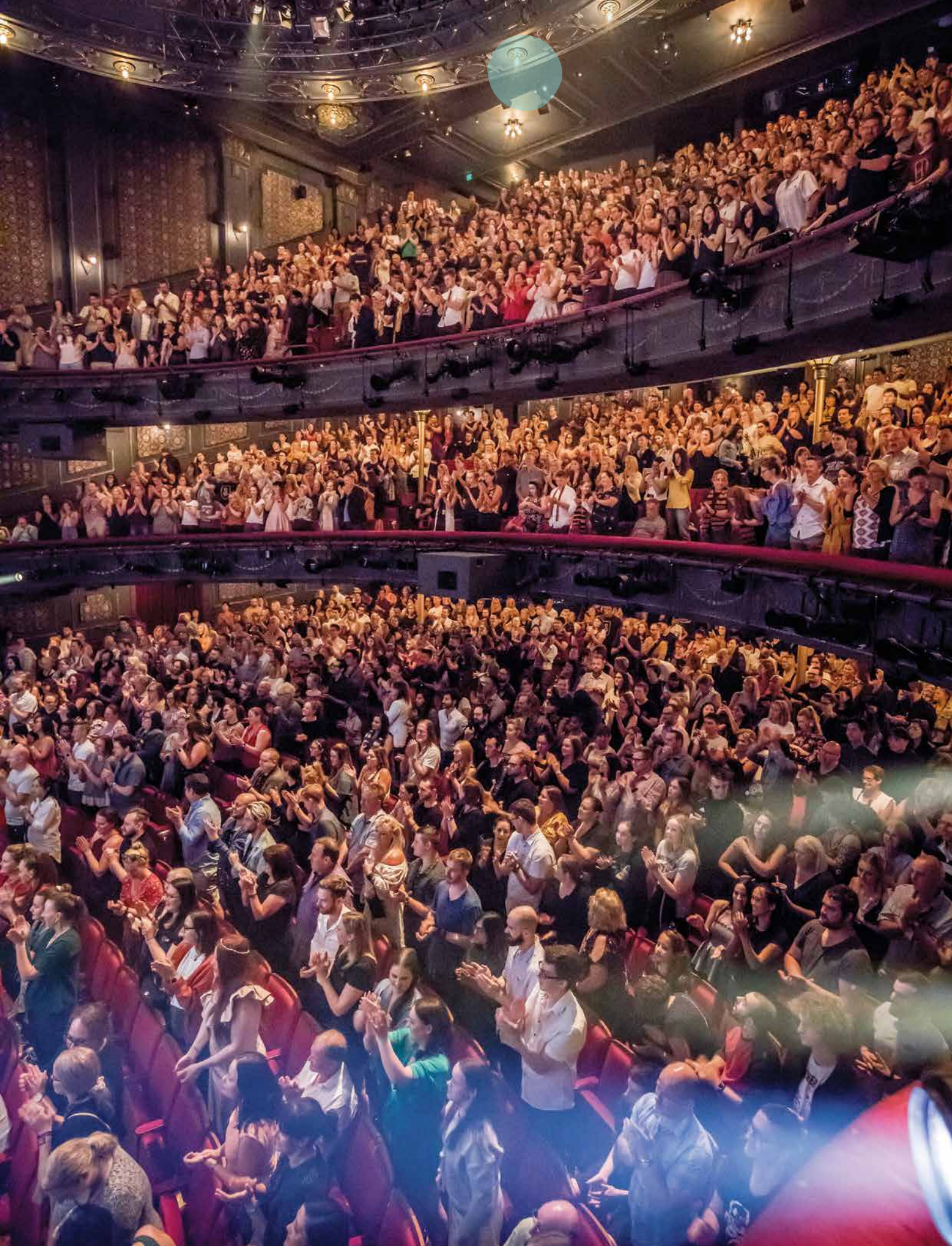
Harry Potter and the Cursed Child first preview audience, 19 January 2019. Credit: Tim Carrafa.